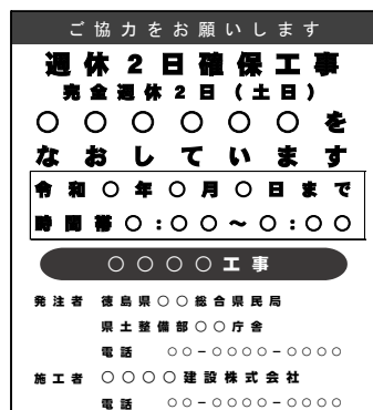
（標示板記載例）完全週休2日（土日）の場合